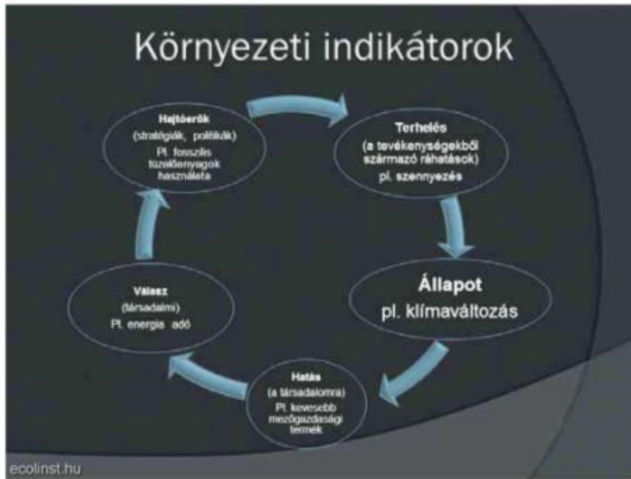
3. ábra: A DPSIR modell; vagyis a környezeti indikátorok rendszere