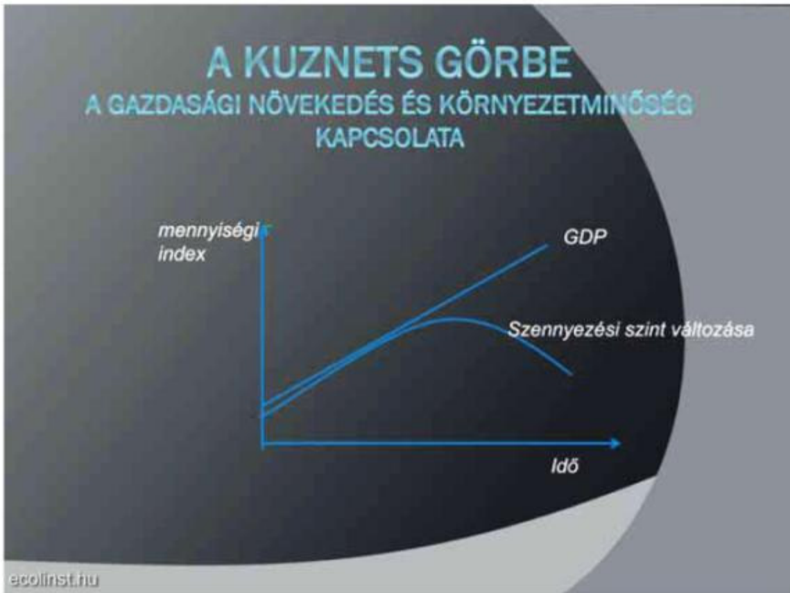
23. ábra A gazdasági növekedés feltételezett hatása a környezeti problémák felszámolására

Abszolút szétválás: (ezt kéne elérni) A GDP növekedése mellett az erőforrásfelhasználás abszolút értékben csökken.